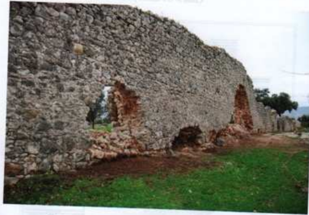
Fotoğraf 2 - Seymenlik kapısının batısındaki surun temizlik sonrası